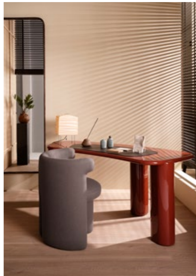
HENRY scrittoio . writing desk CLAUDINE sedia . chair BIRK specchio . mirror