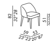
sedia - chair UNO