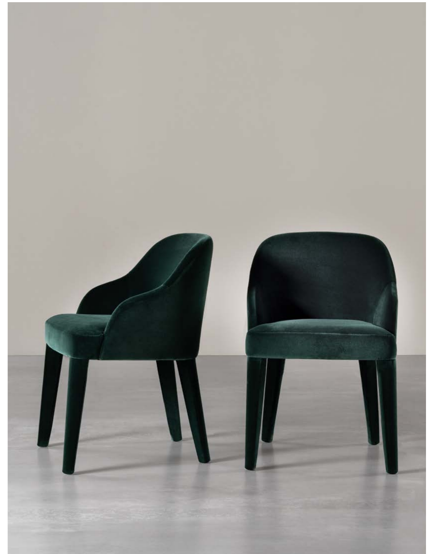
ODETTA DUE sedie . chairs