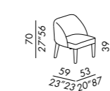
sedia - chair UNO LOUNGE