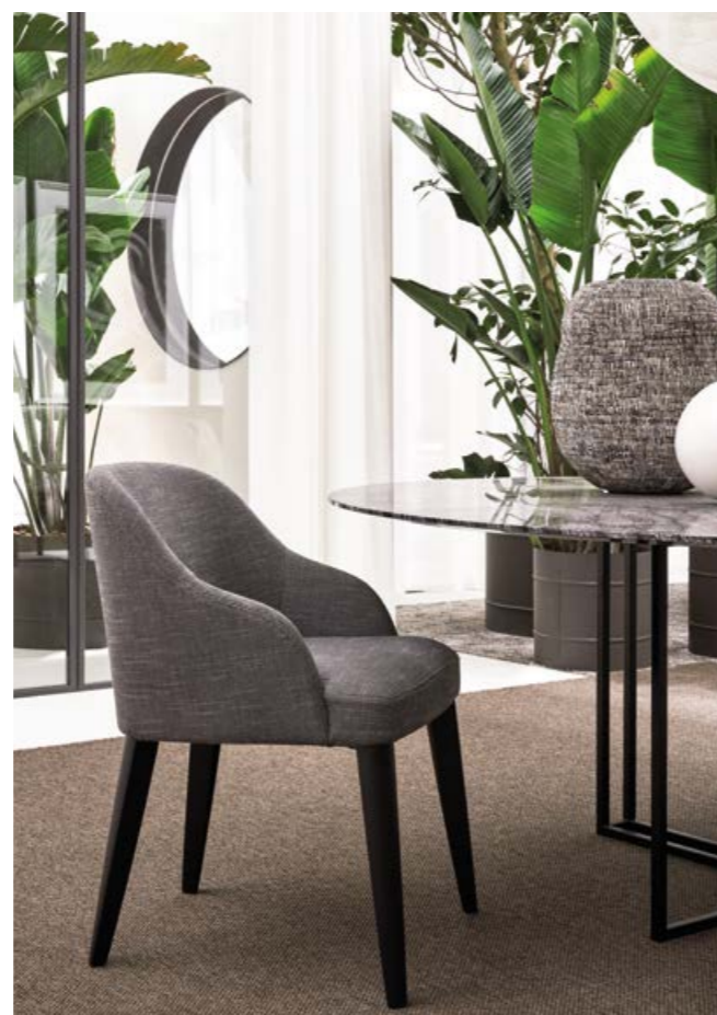
ODETTE DUE sedia . chair PLINTO tavolo . table