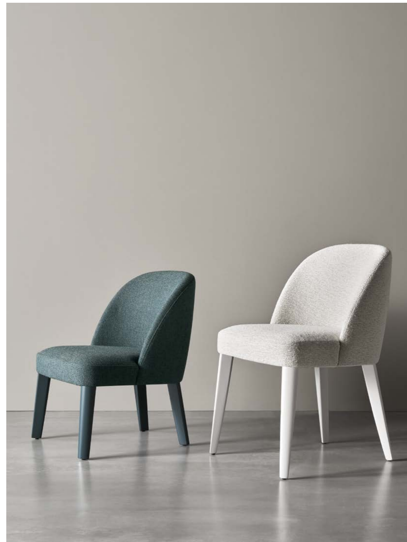
P. 137 ODETTE UNO LOUNGE sedia . chair ODETTE UNO sedia . chair