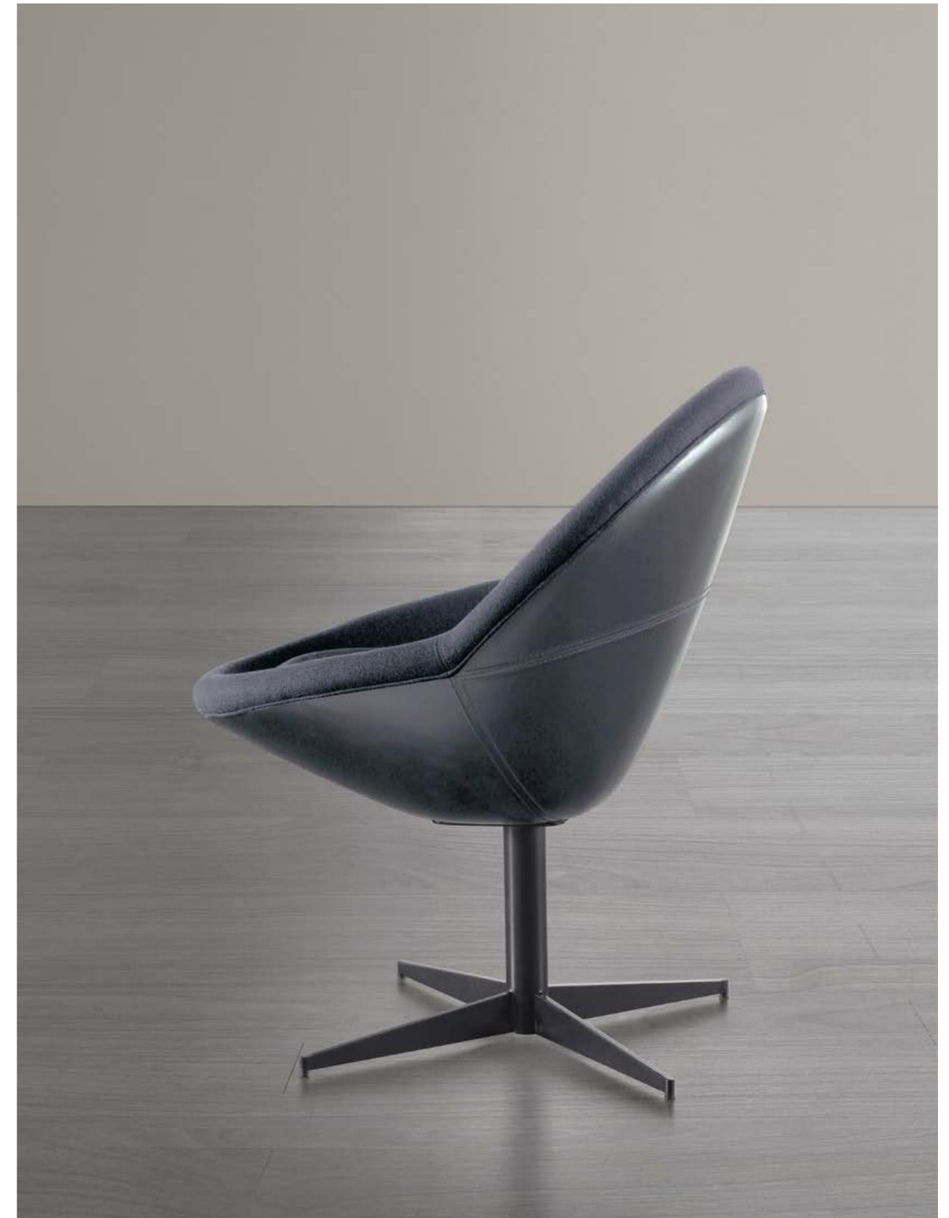
JO poltroncine . small armchairs