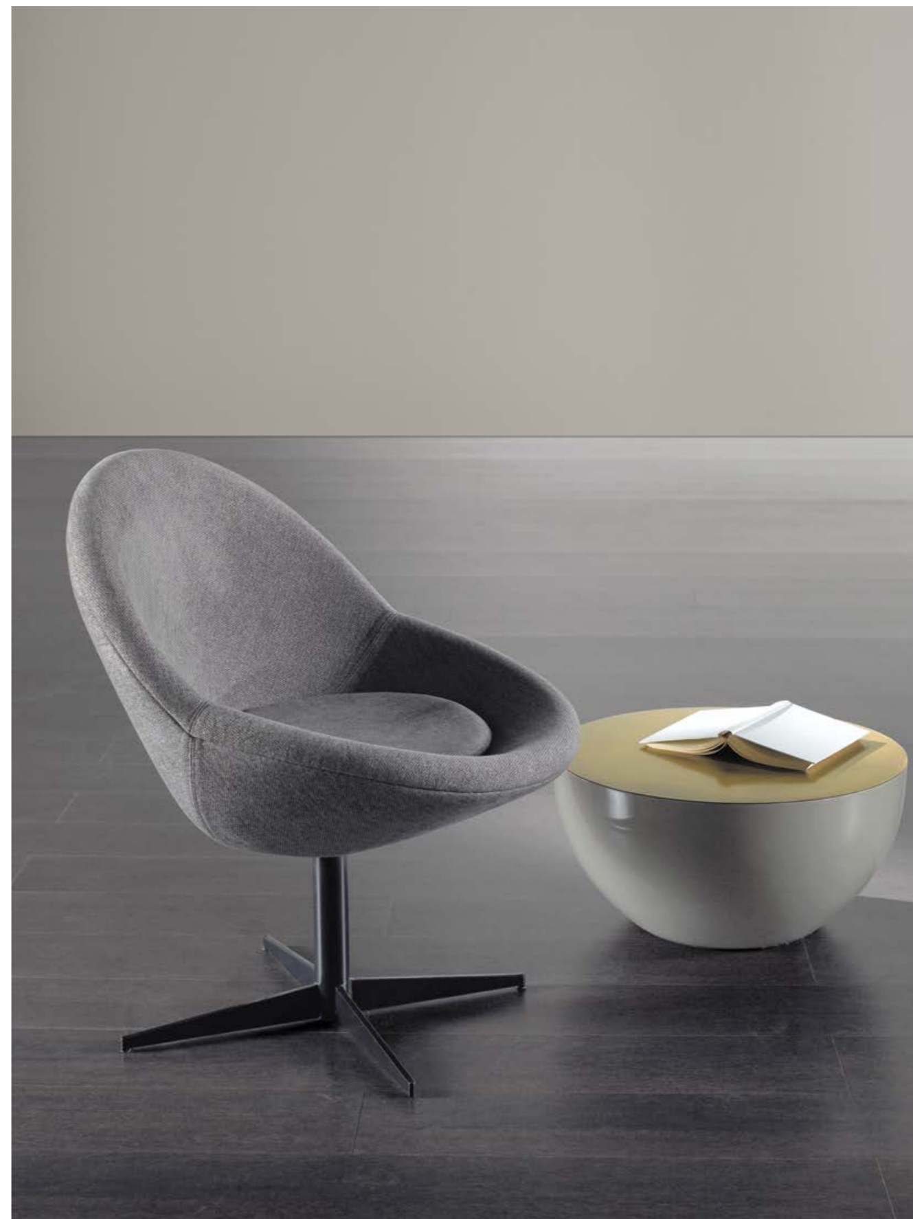
JO poltroncina . small armchair, BONGO TB3 tavolo basso . low table