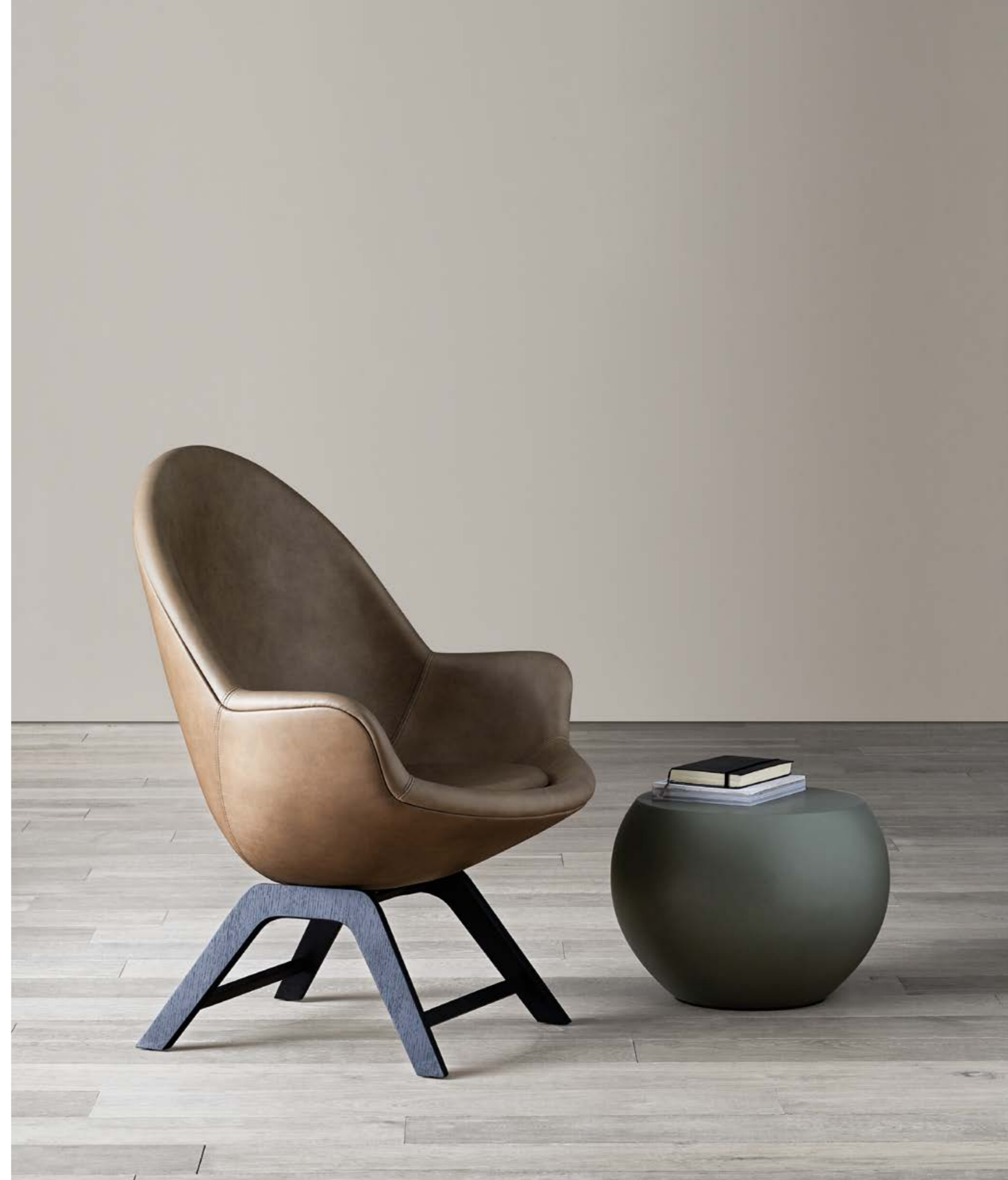
JILL poltroncina . small armchair, BONGO TB1 tavolo basso . low table