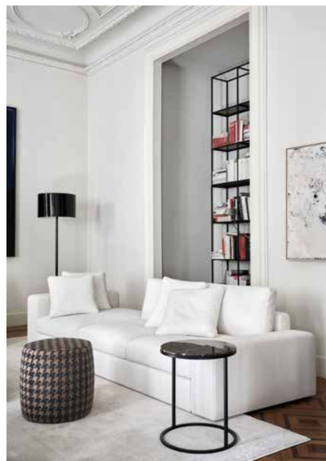
HAROLD divano componibile . modular sofa HAROLD cuscini . cushions classic 80, deco 50 PEK tavolo basso . low table CHARLOT pouf